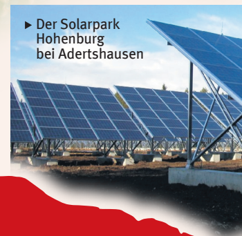
▶ Der Solarpark Hohenburg bei Adertshausen

Eine kleine Auswahl unserer schönsten Rad- und Wanderwege