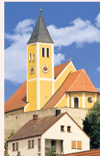
◀ Die Pfarrkirche St. Michael in Allersburg