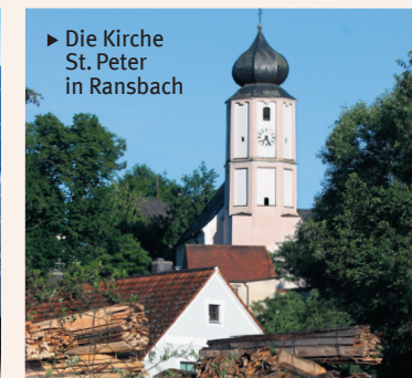
▶ Die Kirche St. Peter in Ransbach