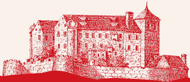
▲ Ansicht der Burg aus dem Jahr 1812